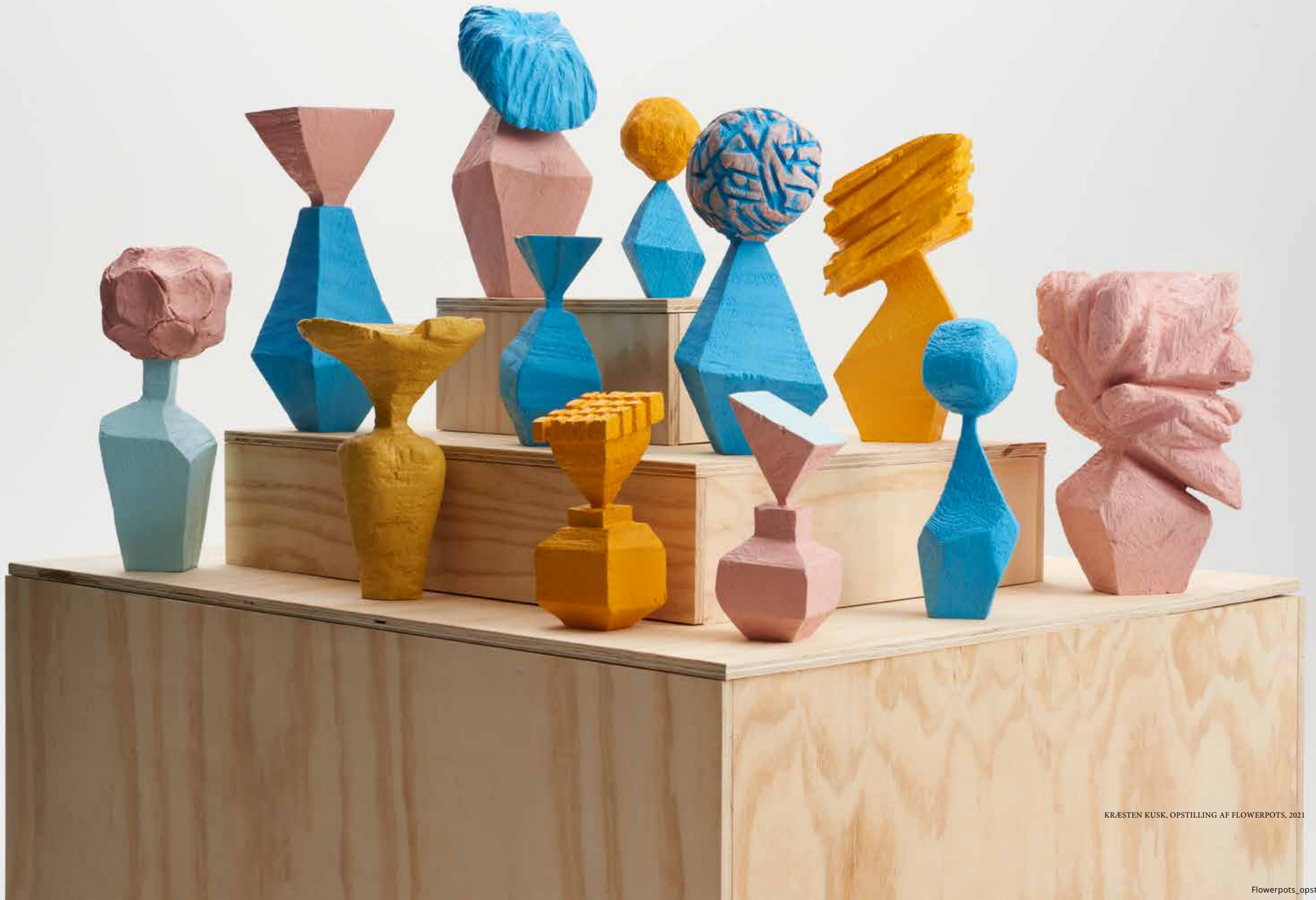
KRÆSTEN KUSK, OPSTILLING AF FLOWERPOTS, 2021